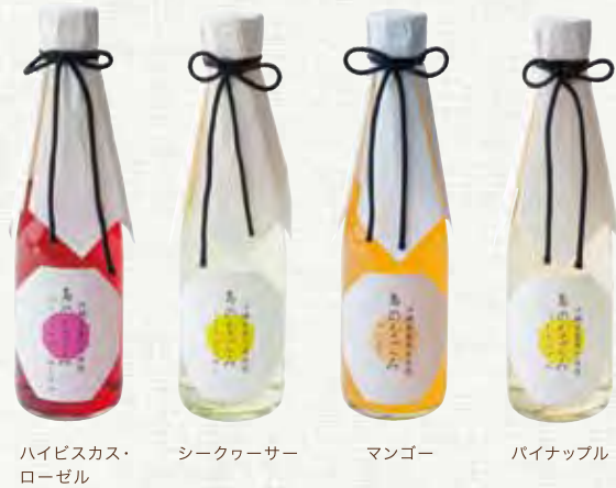
ハイビスカス・ローゼル シークワサー マンゴー パイナップル

名水100選にも選ばれた玉城の美味しい水と、 果実の深みと味わいにこだわった原材料選び。 その香りと味わいは、飲む人をなごみの時間へと誘います。 ハイビスカス・ローゼル、シークワサー、マンゴー、 パイナップルの4つの風味がそれぞれお楽しみいただけます。